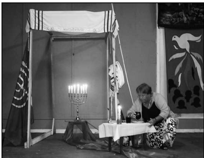
De beker vloeit over

Voor ons was het afscheid in Galiwinku ook een beetje als een "havdalah". We hebben tijd apart gezet om hen meer over de geheimenissen van het Koninkrijk van God te leren. Hun beker vloeit nu over! Zij zullen het geleerde een plaats moeten geven in het leven van alle dag en zich biddend moeten voorbereiden op de vervulling van de wekelijkse Sabbat. Hoe we die dan ook vieren, hetzij volgens de Joodse traditie of op zondag in onze samenkomst, we verwachten allemaal het Koninkrijk van God.