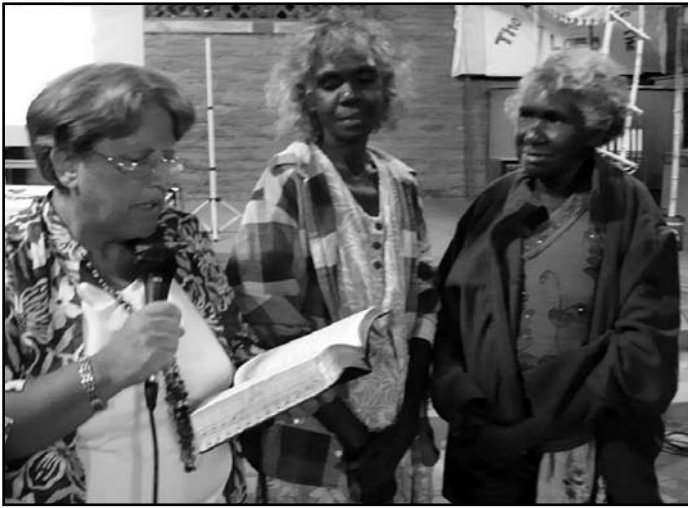
De twee pilaren van Milingimbi

eigenlijk meer een laatste ademhaling van een stervend lichaam. Dat stervend lichaam hebben wij wat leven in mogen blazen en over mogen profeteren. Het leek veel op de dorre doodsbeenderen van Ezechiël. We hebben de twee vrouwen mogen bemoedigen als de pilaren "Jachin en Boaz" in de tempel en de belofte voor de overwinnaars in Openbaring 3:12 over hen uit mogen spreken. Voor hun mannen hadden we een iets ander woord! Wat het resultaat daar van zal zijn, zullen we moeten afwachten. In elk geval was een van hen in de laatste samenkomst. De ander is nog zo gebonden aan hun oude "heilige" en geheime gebruiken, dat hij veel geestelijke zaken vermengt. De situatie van de Aborigines is triest. In dat opzicht hebben de Papua's niets te klagen. We denken dat niemand anders de moeite genomen zou hebben om hier het vuur nog eenmaal aan te wakkeren, daarom zijn we blij dat we gegaan zijn en niet alleen naar aantallen en succes hebben gekeken. We geloven dat de sleutel tot herstel van identiteit en visie, in het bijzonder voor de inheemse volken, te vinden is in het begrijpen van het meesterplan van God.