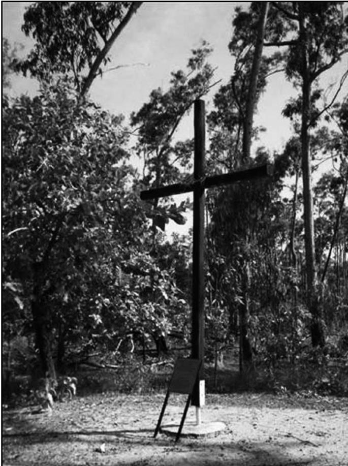
Thuisland in Dharrwar

In Milingimbi konden we slechts een aantal basis principes onderwijzen en enkele dingen vertellen over Israël. Een pas bekeerde jongeman zat met open mond te luisteren en hij en zijn vrouw raakten die avond niet uitgepraat over de boodschap. Voor het eerst begon er iets door te dringen van wat het werkelijk betekent om bekeerd te zijn. De kerk waar deze dorpen toe behoren is de zogenaamde "Uniting Church", die alle "geloven" bij elkaar wil brengen. De grotere kerken hiervan in Darwin zijn verbonden met de Wereldraad van Kerken en de Interfaith organisatie, die ook reizen naar Israël organiseert samen met de Dalai Lama, Moslim leiders, Hindoes, Boeddhisten etc. Sinds kort mogen homoseksuelen ook de kerk leiden en zijn homoseksuelen huwelijken toegestaan. De voorganger uit Milingimbi had het te druk met de "Aboriginal Tak" van deze kerk in Noord Australië en kon daardoor geen aandacht geven aan de plaatselijke gemeente. Het Aboriginal forum bepleit dat traditionele ceremonies bewaard kunnen blijven als onderdeel van het "kerkleven". Helaas was er weinig over van het kerkleven. De kerk zelf was een vervallen gebouw, geplunderd en gebruikt door "petroleum snuivende" jonge Aborigines. Dit is waar we onze samenkomsten hielden voor een handjevol mensen, waar van sommigen in 9 of 10 jaar niet in de kerk waren geweest, maar nu hun leven opnieuw aan de Heer hebben toegewijd. De twee vrouwen zijn hun "voorgangers". Gelukkig dat God vrouwen toestaat om te spreken!