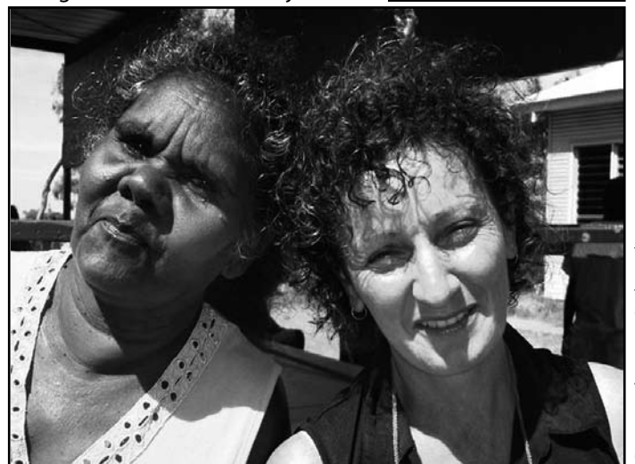
Danganbarr en Deborah