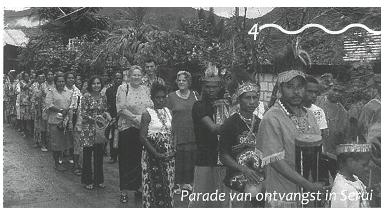
Parade van ontvangst in Serui