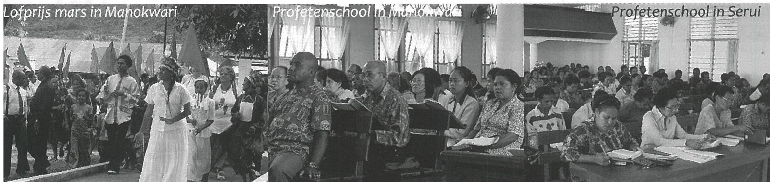
Profetenschool in Serui