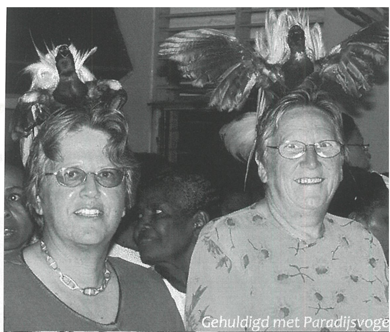
Gehuldigd met Paradijsvogel