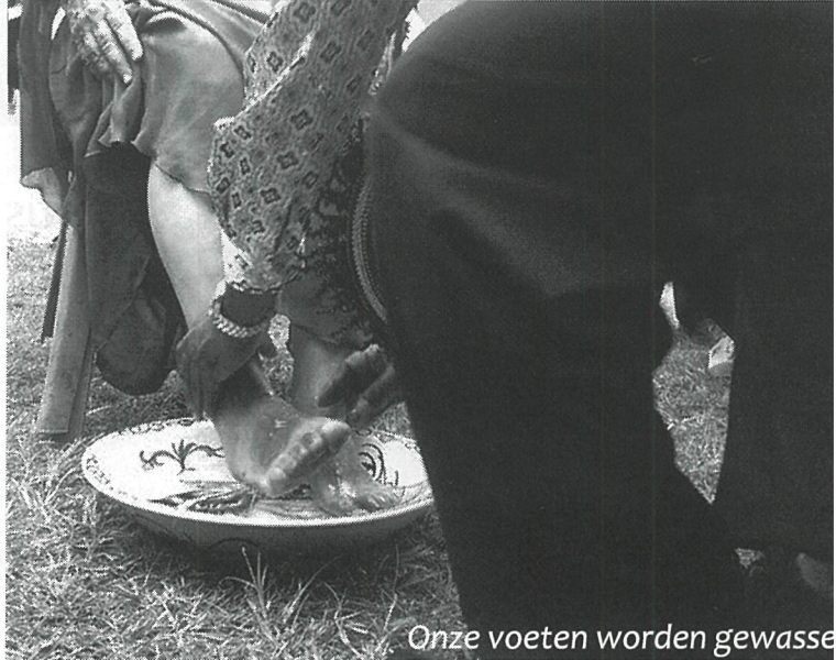
Onze voeten worden gewassen