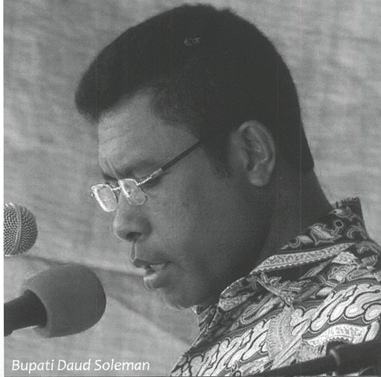
Bupati Daud Soleman