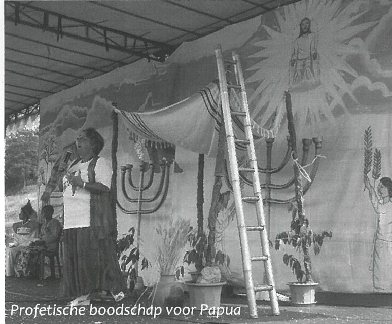
Profetische boodschap voor Papua