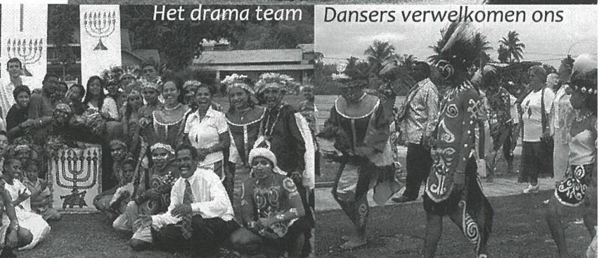
Dansers verwelkomen ons