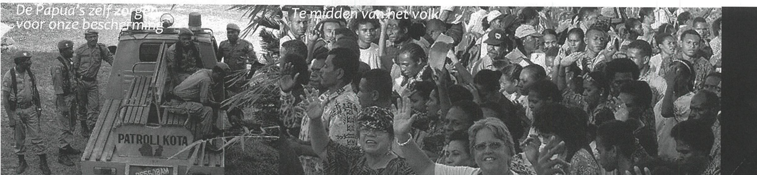
Te midden van het volk