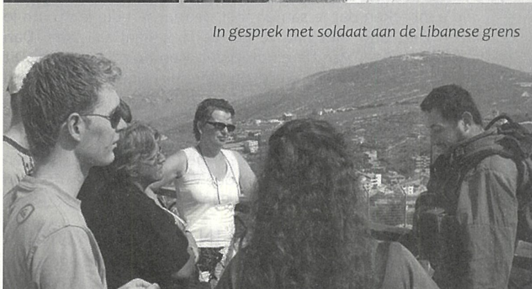
In gesprek met soldaat aan de Libanese grens