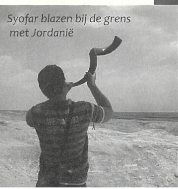
Syoфар blazen bij de grens met Jordanië