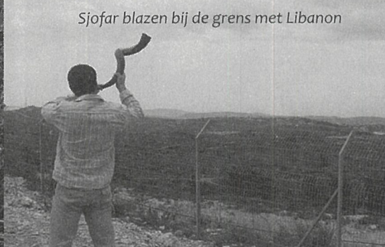
Sjofar blazen bij de grens met Libanon