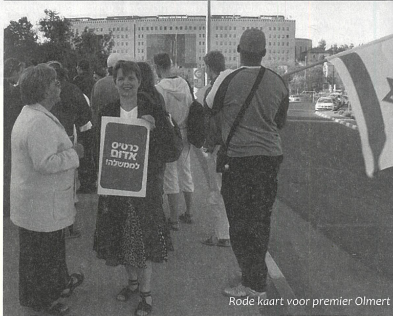
Rode kaart voor premier Olmert