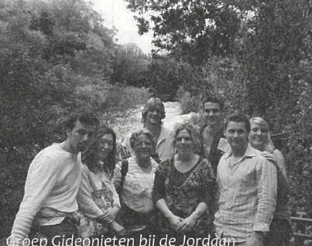
Groep Gideonieten bij de Jordaan