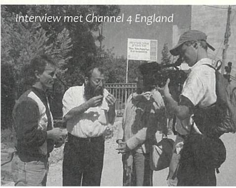
Interview met Channel 4 England