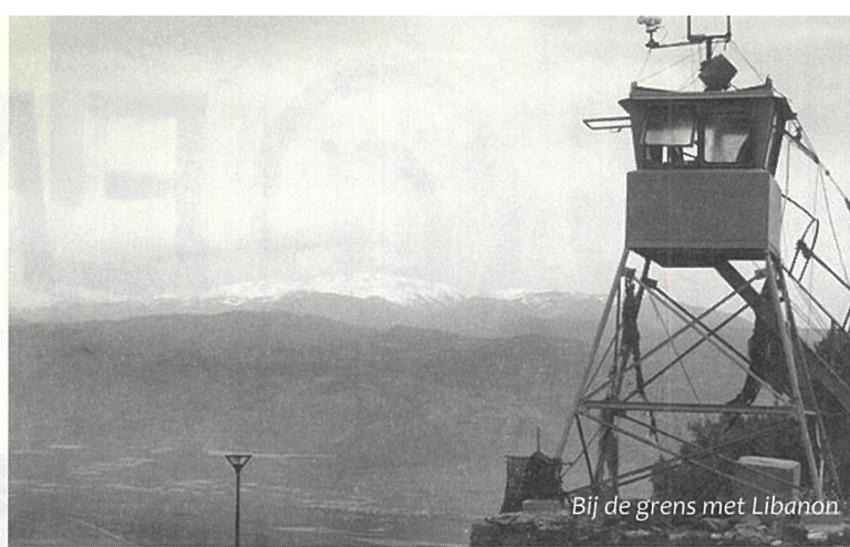
Bij de grens met Libanon

We zien in deze tekst een bevestiging van wat God aan het doen is. Hij brengt de jeugd bij elkaar als dauw op de bergen van Israël op de dag dat de Messias ten strijde trekt. De Heer wordt in de context van deze psalm in verband gebracht met Melchisedek. Als wij een groep in Israël verwelkomen dan doen wij dat altijd in de “Koningsvallei” (Kidrondal), de plaats waar Melchisek Abraham verwelkomde met brood en wijn (Gen. 14:17-20). Hij was een voorafschaduwing van de Koning der gerechtigheid die zal komen om de natiën te berechten. Er staat dat hij onderweg zal drinken uit de beek en Zijn hoofd op zal heffen. Toen de Gideonieten verzameld werden, dronken zij ook uit de beek. Misschien dat we aan het einde van de strijd samen met de Heer uit de beek mogen drinken die straks vanuit de Tempel gaat stromen en met Hem ons hoofd op mogen heffen ten teken van de overwinning.